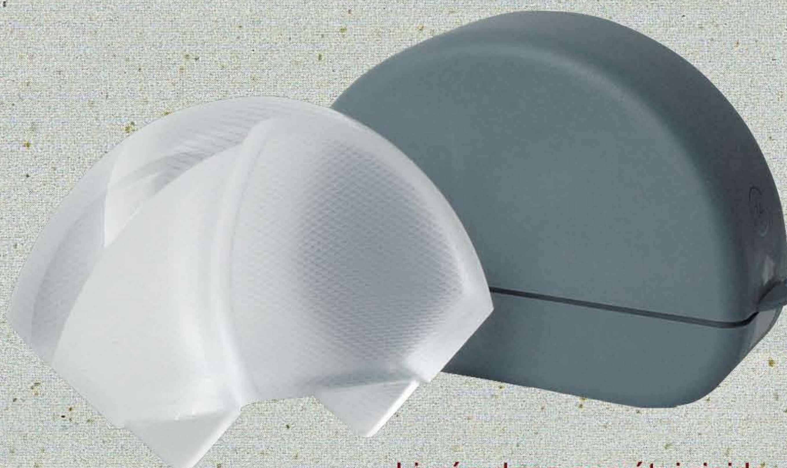
Livrée dans son étui rigide