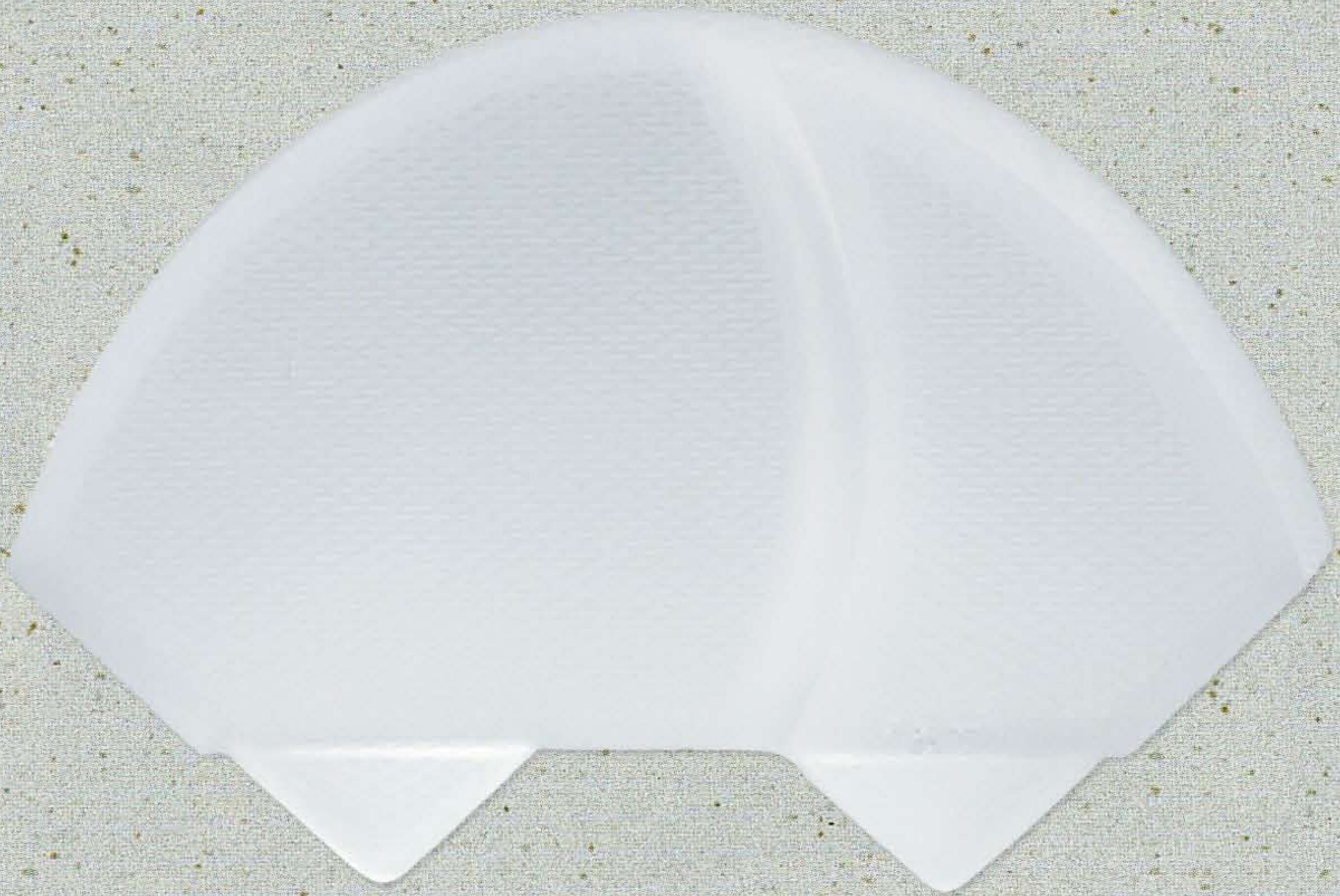
La T4 possède un design unique.

La loupe T4 est un monobloc de polyméthacrylate d'une grande pureté, qui allie une ergonomie parfaite à une esthétique contemporaine.